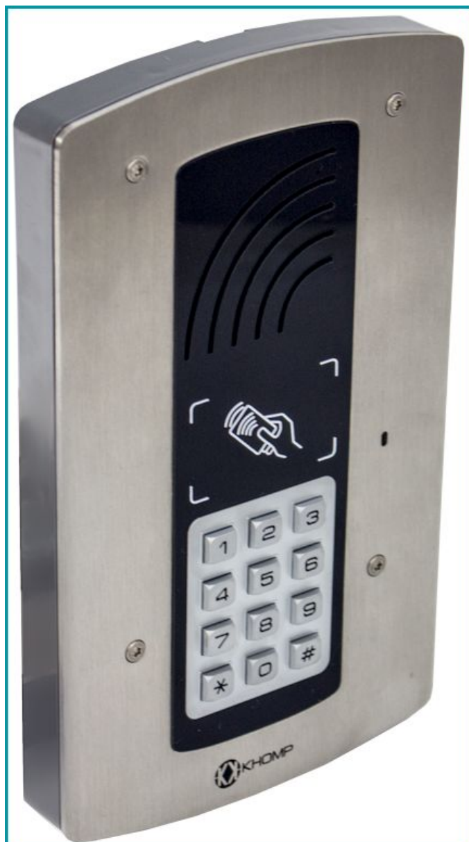
Legenda: Visão lateralizada dos modelos IP Wall 301 SR e IP Wall 312 SR (respectivamente).