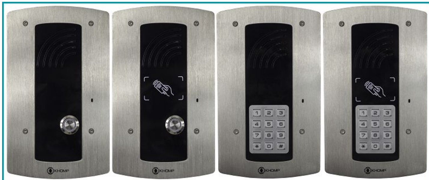
Legenda: Parte frontal dos modelos IP Wall 301 S e IP Wall 312 S (exemplos sem leitor e com leitor RFID integrado).